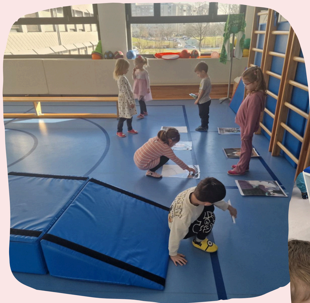
Dejavnost v telovadnici