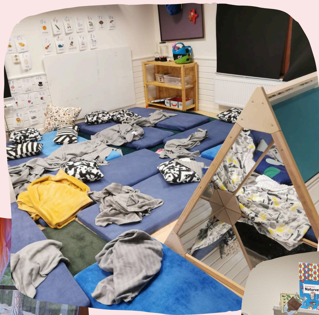
Soba za spanje