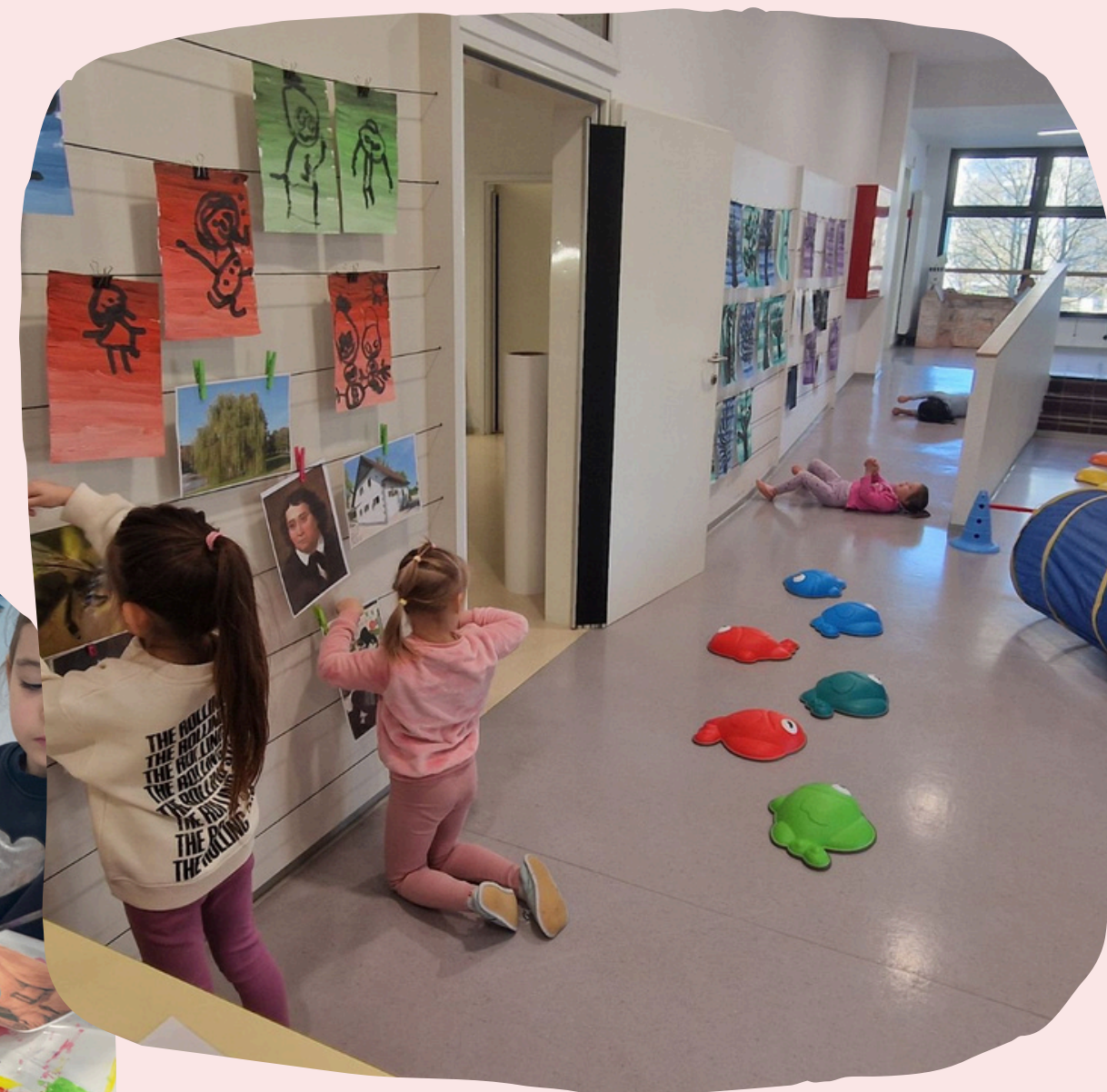
Dejavnost v predprostoru