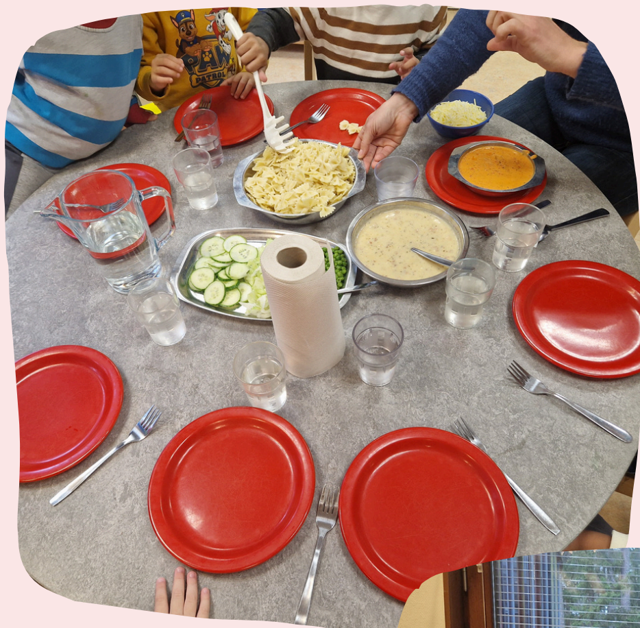
Soba za obroke