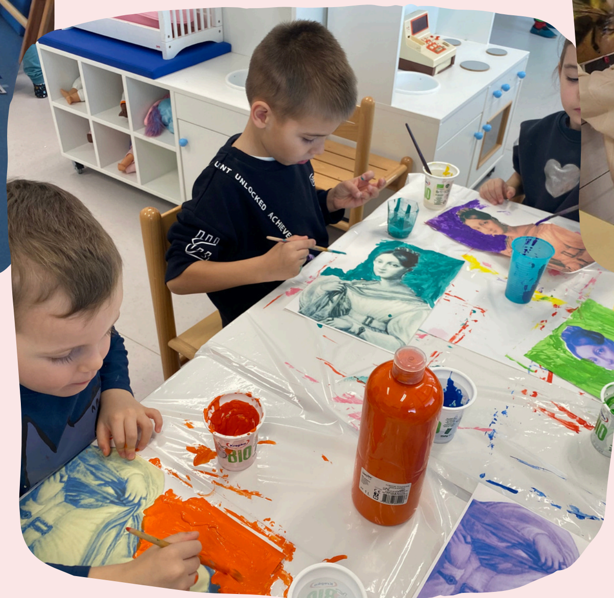
Dejavnost v igralnici