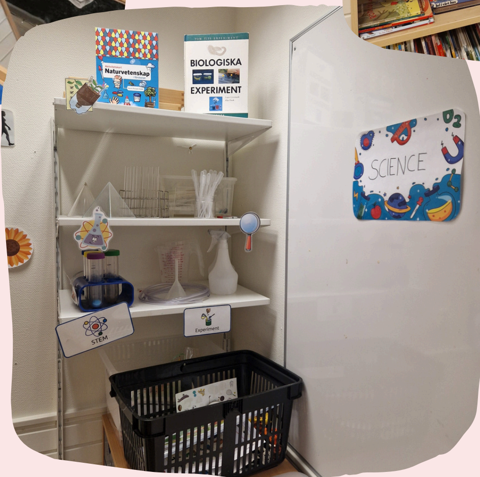
Soba za naravoslovje