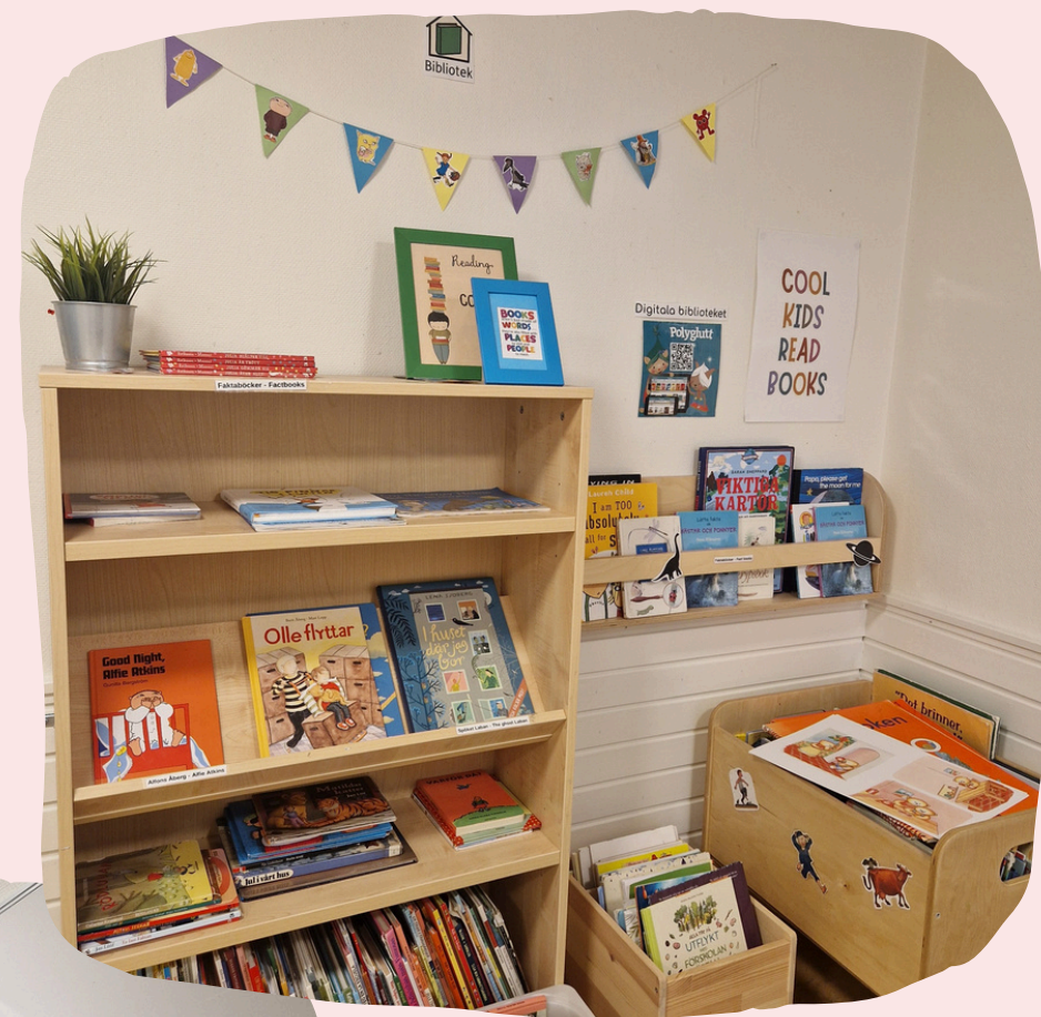
Soba za branje