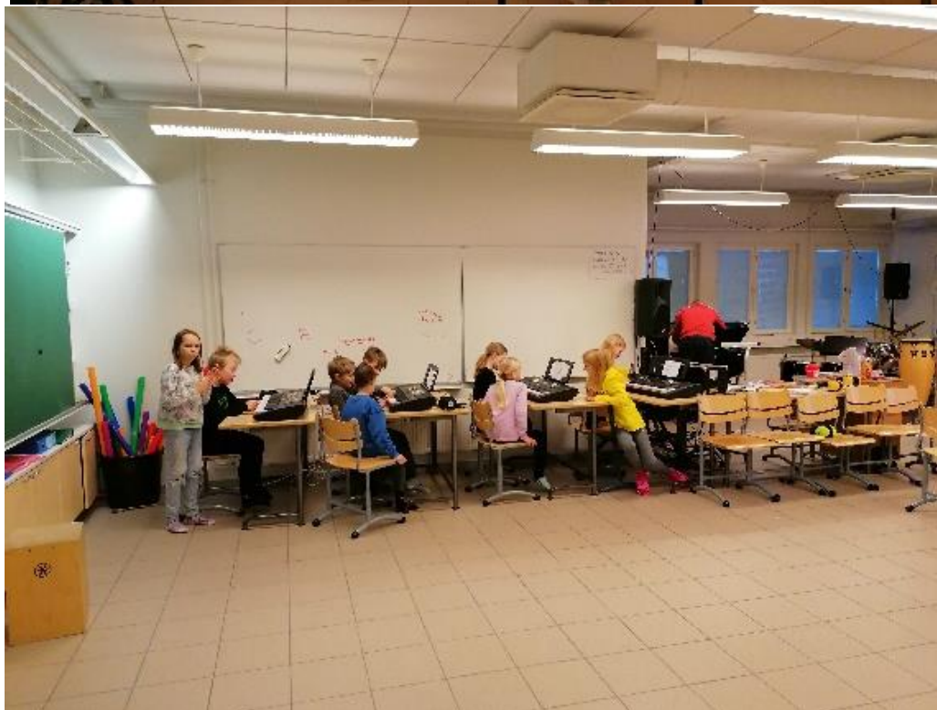
Na sliki: predloga pesmice opremljene z liki in barvami; finski otroci za klaviaturami